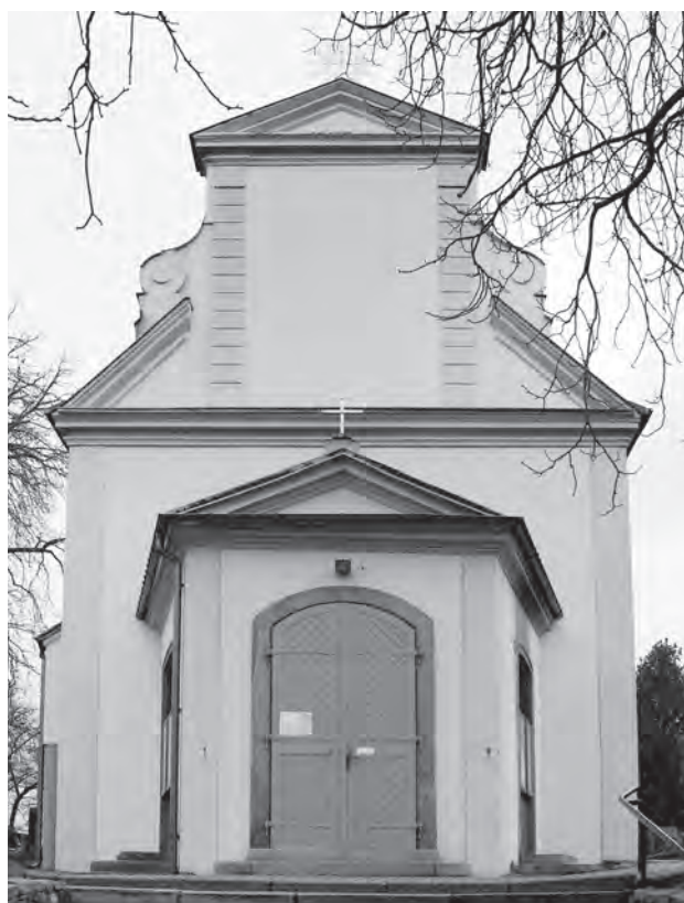
Modřany, kostel Nanebevzetí Panny Marie

z Vlkanova, kterého už 3. 7. 1363 vystřídal kněz Frenclinius. Po jeho předčasné smrti se prebendy ještě téhož léta 1363 (23. 10.) chopil klerik Ondřej z Jeníkova. Od 1. 10. 1366 zde byl farářem do své smrti r. 1380 kněz Mikuláš. Po něm se obročí 7. 3. 1380 ujal Markvart ze Soběšina, r. 1394 v úřadu zesnul jeho nástupce Pavel a správcem kostela a fary se 23. 11. 1394 stal Mikuláš z Miroslavi, kterého prezentoval vyšehradský kanovník Petr, k jehož prebendě tehdy náleželo patronátní právo kostela. Vizitace z r. 1380 se soustředila především na liturgické vybavení kostela, kde kritizovala špatně svázaný starobylý misál, starý žaltář