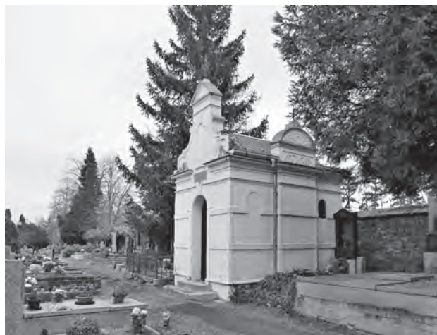
Modřany, hřbitov u kostela, foto Klára Mezihoráková, archiv ÚDU AV ČR

L: F. Hansl a kol., 1899, 302; P. Kovařík 2001, 114–115.