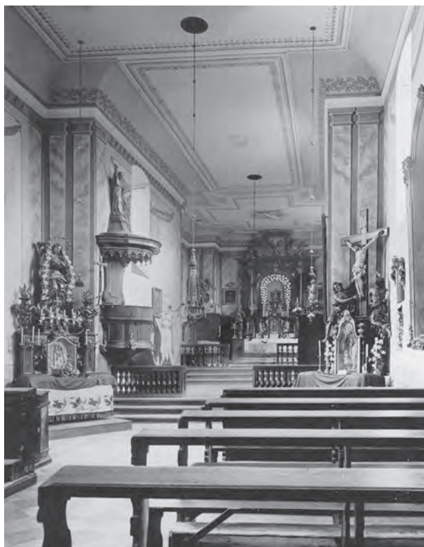
Modřany, kostel Nanebevzetí Panny Marie, interiér, pohled k východu, 1977