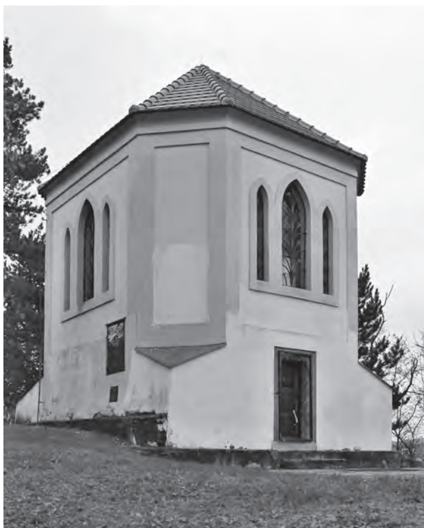
Modřany, zvonice u kostela Nanebevzetí Panny Marie