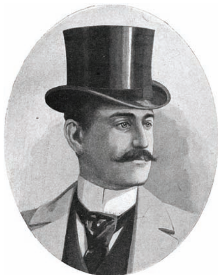
Mathieu Dreyfus na kresbě z La Vie Illustrée (přelom 19. a 20. století, https://gallica.bnf.fr ).