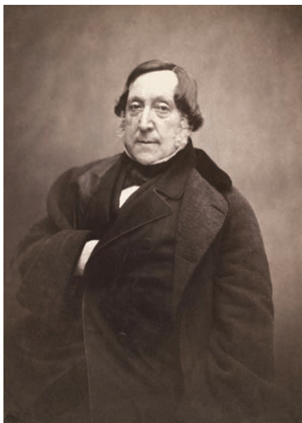
Nadarova fotografie Rossiniho, autora Želmíry (před 1868).

Podnik fungoval hned vedle budovy Nové scény, v rámci rozsáhlého komplexu staveb spadajících pod řád voršilek (kostel, klášterní budova, školní budova, zahradní pavilon a socha Jana Nepomuckého). Raněbarokní urbanistický celek, rámovaný ulicemi Národní, Voršilská a Ostrovní, byl dokončen kolem roku 1680; následovaly pozdněbarokní úpravy. V roce 1951 komunistický režim klášter zavřel. V horních patrech pak zahájil činnost Výzkumný ústav endokrinologický, v přízemí otevřela svou náruč vinárna, odnepaměti řečená Želmíra. Odkud ta přezdívka? Možná se anonymní kreativec inspiroval u stejnojmenné opery Gioachina Rossiniho (1822), která byla ostatně doma i v repertoáru sousedního Národního divadla; možná se ale inspiroval úplně jinde.