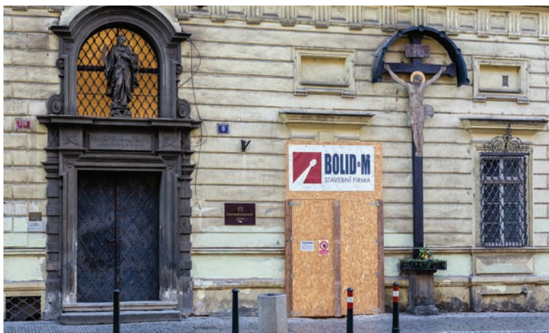
Klášterní vinárna čili Želmíra dnes.

říkal, že tam je jediný jídelní lístek v celé Praze, který stojí za čtení“. 21 Na vánočním menu tu prý měli dokonce šneky. Na jistou souvislost s touto dekadencí a jejími případnými vyznačiči v časech komunistické totality poukazuje básník Ivan Diviš: „Ne nadarmo byla vinárna Viola – ale taky klub Čs. spisovatele a třeba Želmíra – pár kroků od Bartolomějské.“ 22 V Bartolomějské 14, takzvané Kachlíkárně nebo Barťáku, měla za minulého režimu sídlo Státní bezpečnost.