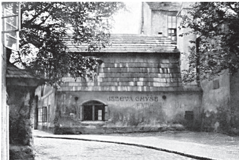
Jedová chýše na anonymní fotografii (po roce 1900).