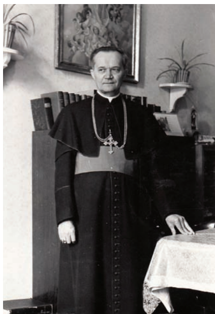
Ve svém pokoji v Šebetově