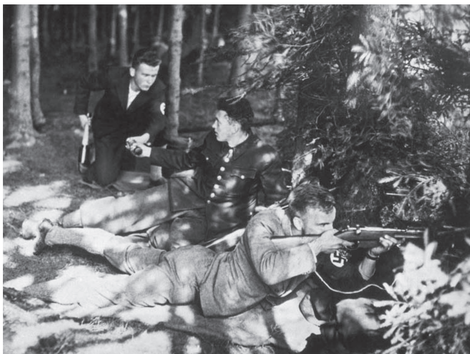
Jedna z mnoha henleinovských bojůvek

30/9 zaútočila jednotka Freikorpsu podporovaná příslušníky SA na budovu velitelství jednotek československé armády v Horním Benešově. Po krátké přestřelce byli útočníci odraženi.