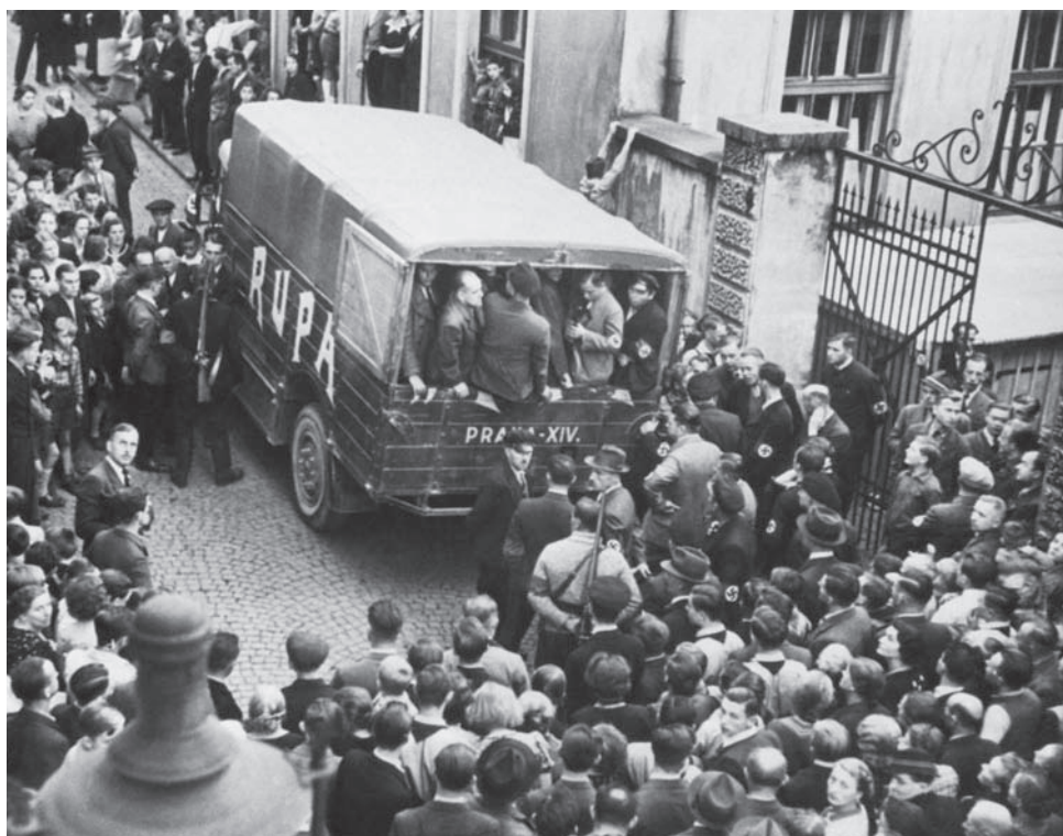
Ordneři začali po mnichovském diktátu okamžitě se zatýkáním československých občanů a německých antinacistů v Aši.

V NOCI Z 30/9 NA 1/10 došlo na Karvinsku a Ostravsku k řadě teroristických útoků polských ozbrojenců přes československou hranici. U obce Ráj zaútočila od polské obce Otrębów na osmičlenné družstvo Stráže obrany státu asi dvanáctičlenná skupina polských ozbrojenců, vybavená střelnými zbraněmi a granáty. Po použití kulometu a granátů z české strany se polští ozbrojenci stáhli. Stanoviště Finanční stráže v Radvanicích bylo ostřelováno z polského území kulometem.