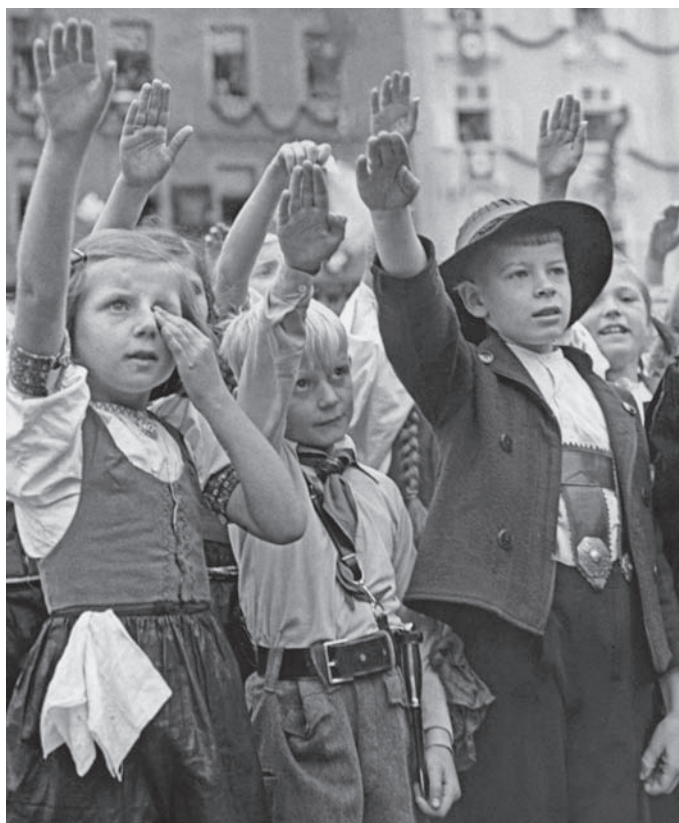
Německé děti v Chebu