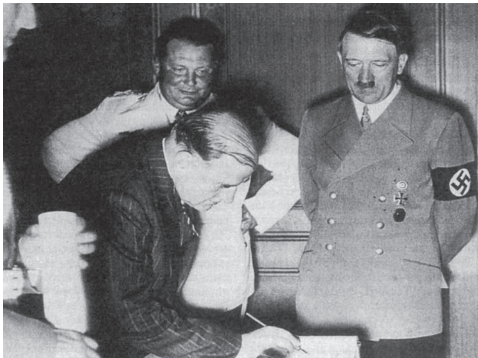
Podpis Mnichovské dohody