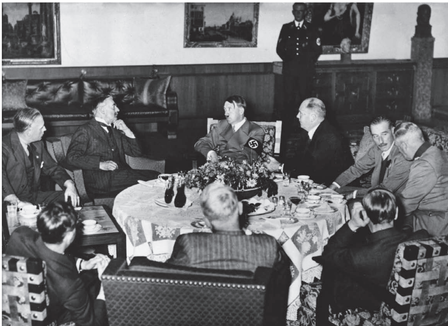
Jednání evropských politiků s Adolfem Hitlerem v Mnichově

odmítla kapitulaci a nenese za Mnichovskou dohodu žádnou odpovědnost.