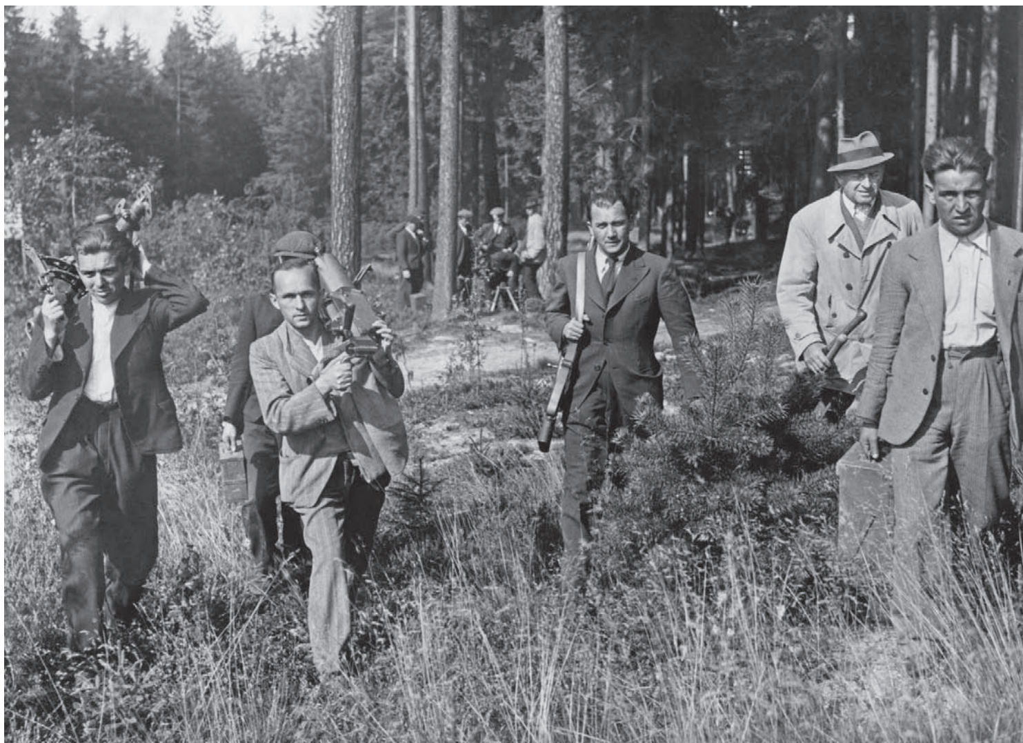
Bojůvka Freikorpsu nedaleko Aše